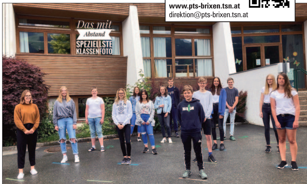
Klassenfoto mit Abstand