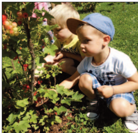
Zuerst werden die reifen Beeren gepflückt ...

Erntezeit – die Ribiseln sind soweit! Wir machen Ribiseltörtchen