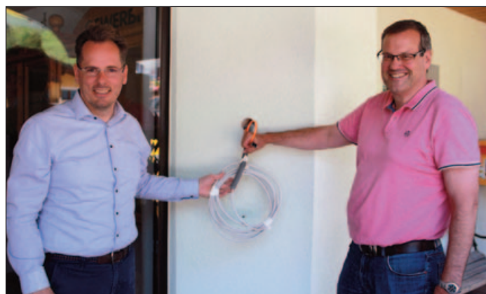
Geplanter Standort für den Infopoint

Die mit der Ausführung beauftragte Firma Infopoint PlanungsgmbH ist für die Projekt-Information, die Einholung des Feedbacks und in weiterer Folge für eine allfällige Datenanbindung zuständig und wird sich mit den Betrieben in Verbindung setzen.