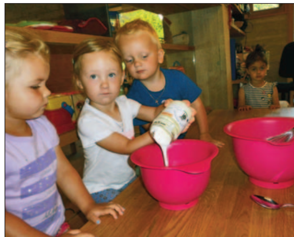
dann wird der Teig gemacht ...