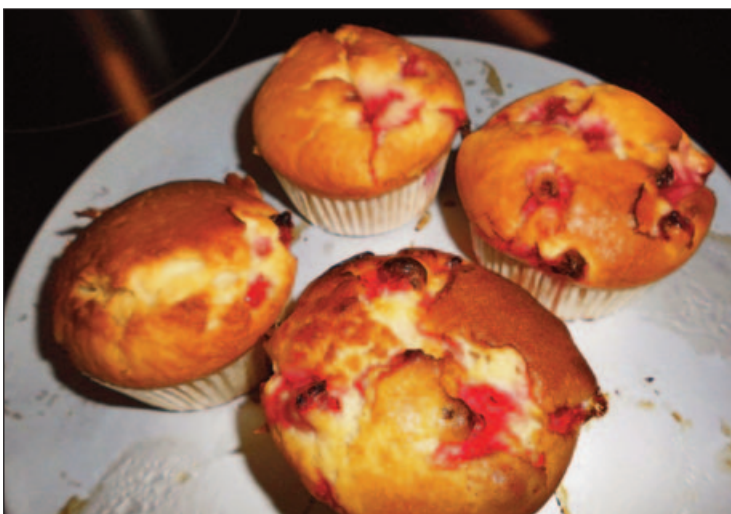
die Ribiseltörtchen sind fertig!

In der Kinderkrippe Dorfwerge gibt es in der Nachmittagsgruppe (Montag und Dienstag 13.00 bis 17.30 Uhr) für Herbst 2020 noch freie Plätze ☺. Die Nachmittagsbetreuung dürfen ALLE Kinder (ab 18 Monaten bis Kindergartenalter) in Anspruch nehmen. Gemeinsam die Natur entdecken, mit gleichaltrigen Kindern spielen, tanzen und lustig sein. Für Anmeldungen sind wir wochentags von 7.15 Uhr bis 13 Uhr erreichbar unter Tel. 0664 88 50 17 73!