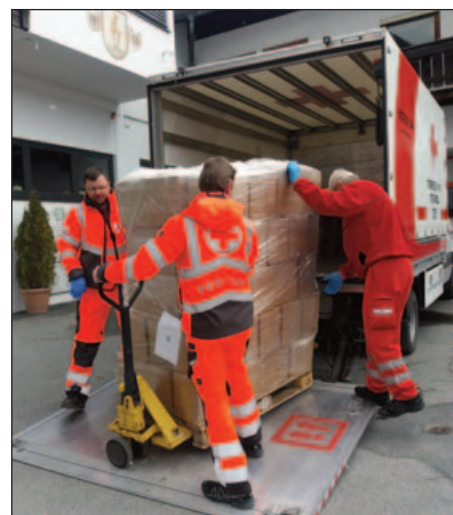
SEG-Technik beim Abholen und Verteilen der Schutzausrüstung