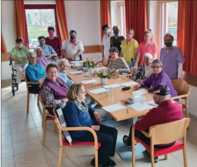
Danke für eure Unterstützung und Hilfe

Nur durch euer Verhalten können wir die Gesundheit unserer Bewohner gewährleisten.