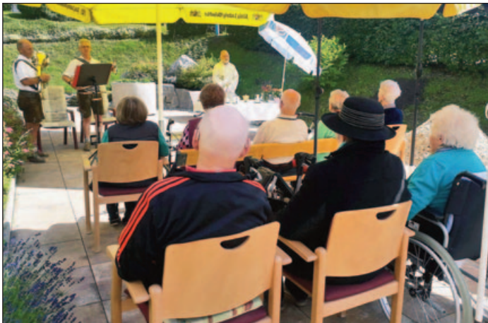
Gottesdienst auf der großen Terrasse