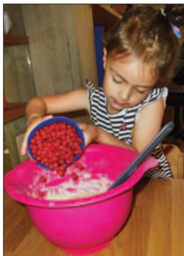
die Ribiseln kommen hinein ... es wird fest handgerührt ...