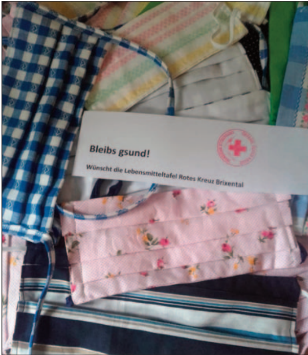
Mund-Nasen-Schutz genäht von den Mitarbeiterinnen der Lebensmitteltafel

Einige Mitglieder der Lebensmitteltafel haben Mund-Nasen-Schutz-Masken genäht. In Kooperation mit den Brixentaler Kaufmannschaften wurden die Masken an Geschäfte und örtliche Betriebe ausgegeben. Die Ortsstelle bedankt sich bei den fleißigen Näherinnen und allen Spendern für diesen tollen Beitrag zur Bewältigung der Corona-Krise.