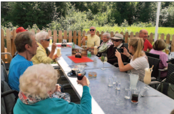
Ausflug zum Reischerwirt in Going