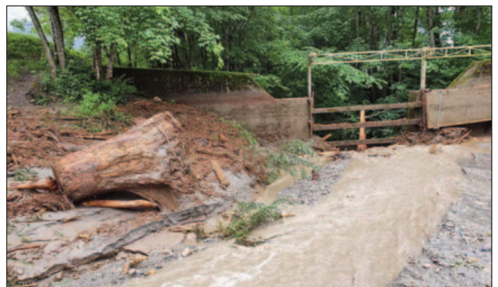
Das Geschiebefangbecken in Blickrichtung Hof – die Bauwerke haben viel Schaden abgehalten. Den Pegelstand des Unwettertages sieht man bei der linken Mauer am Moosbewuchs.