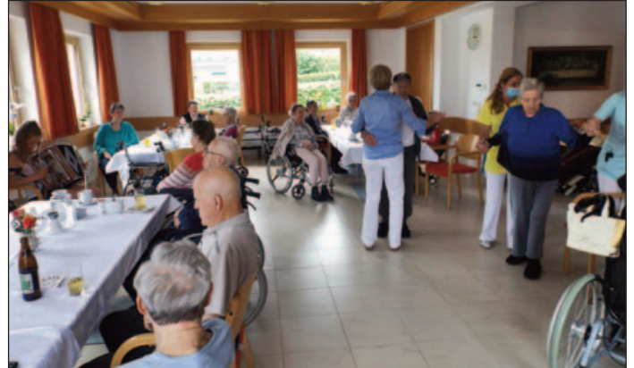
Muttertagsfeier – leider ohne Angehörige