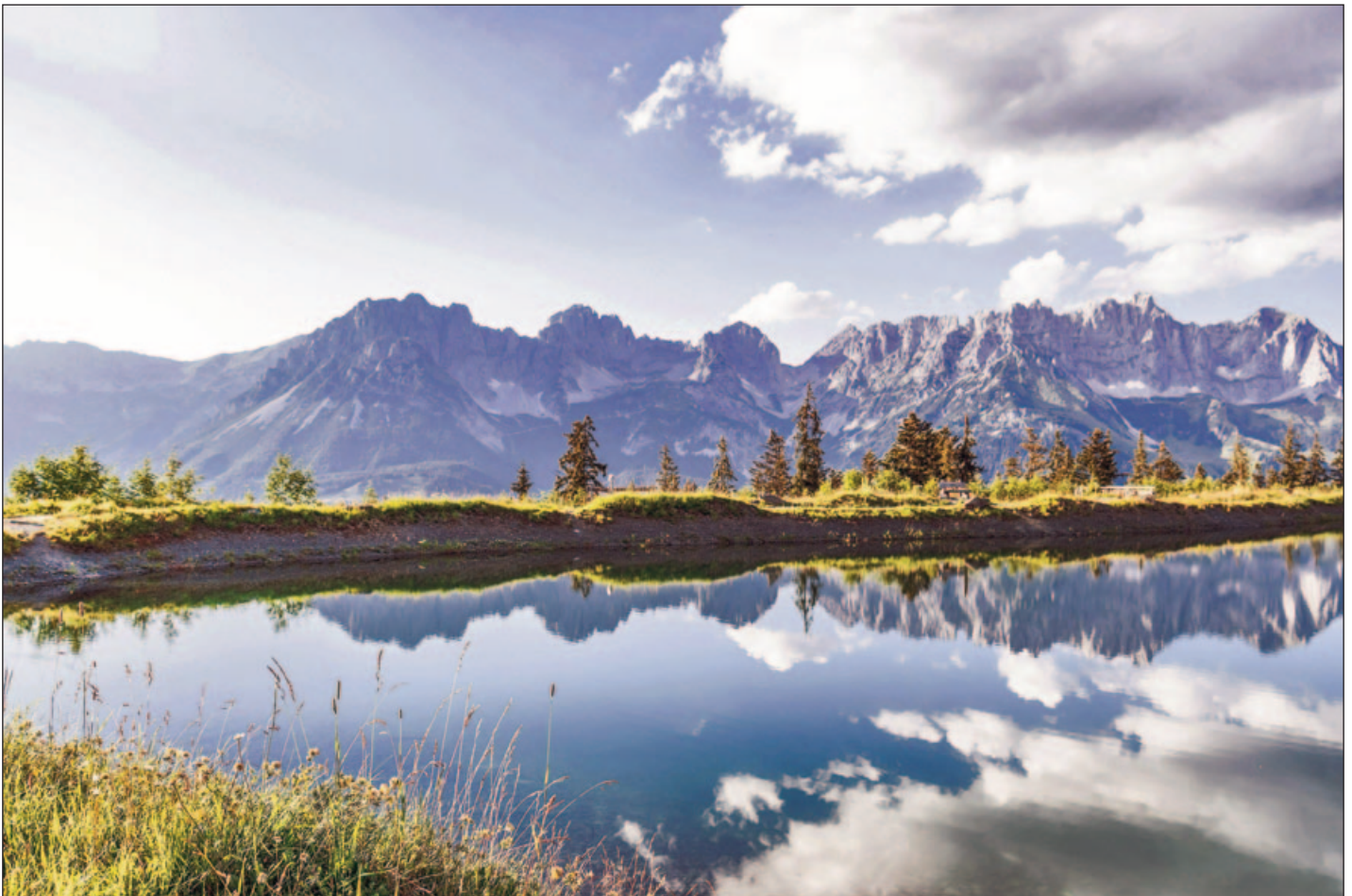
Am Astbergsee in Going